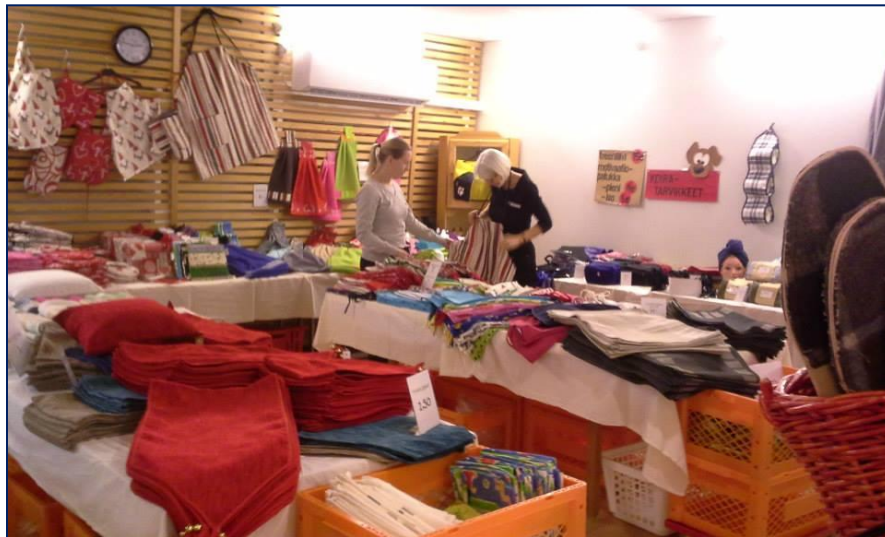
Ventes d'objets artisanaux à Monikko