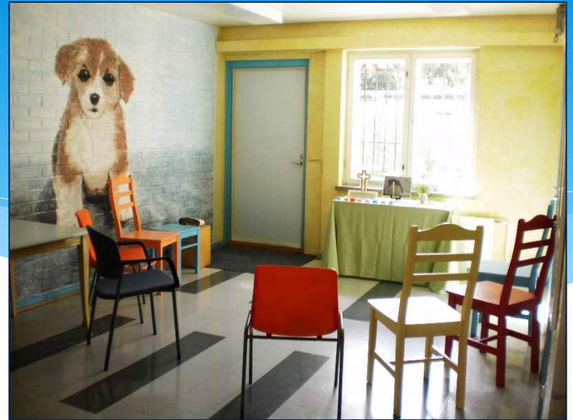
Une chapelle dans l'espace de retraite spirituelle