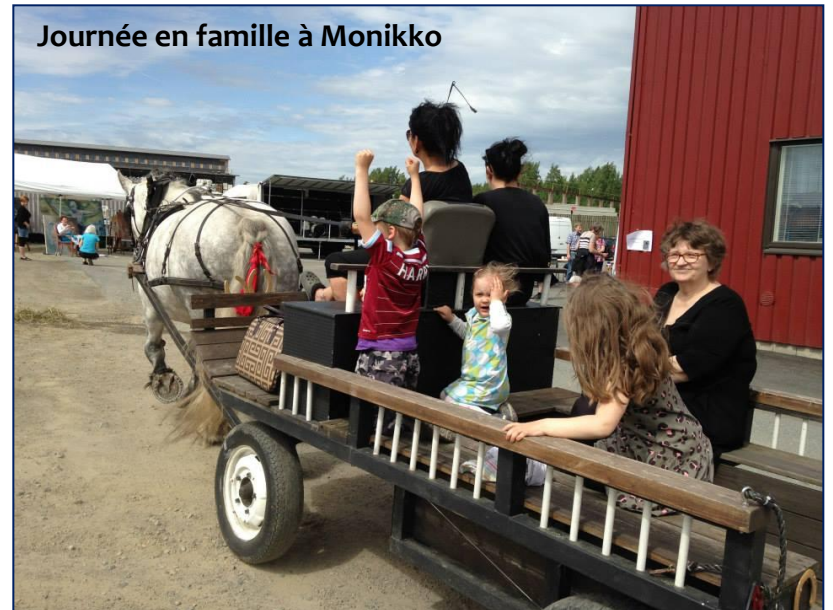
Journée en famille à Monikko