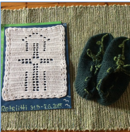
Retriittiläiset tekivät retriitin aikana monia kauniita käsitöitä, kuvassa erään retriittiläisen kiitos retriittiohjaajille

Erään vankeinhoidossa 30 vuotta työskennelleen rikosseuraamusmiehen mukaan hän ei ole koskaan uransa aikana vierailut naisosastolla, jonka ilmapiiri oli niin rauhallinen ja HILJAINEN.