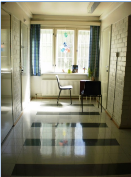
Osaston hiljainen nurkkaus