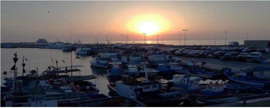
Kuva ravintolan terassilta auringonlaskun aikaan

Ensimmäinen, tapahtumarikas ja hieno seminaaripäivä oli takanapäin!