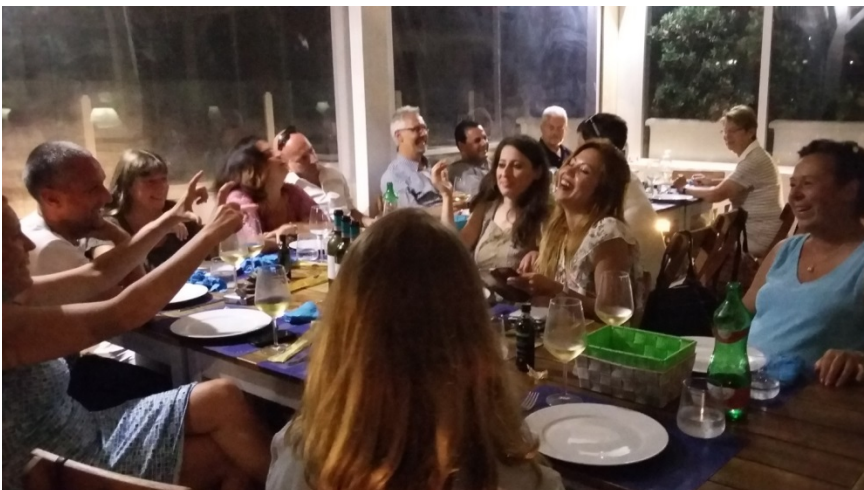
FEFI partners enjoying local "catch-of-the-day" meal