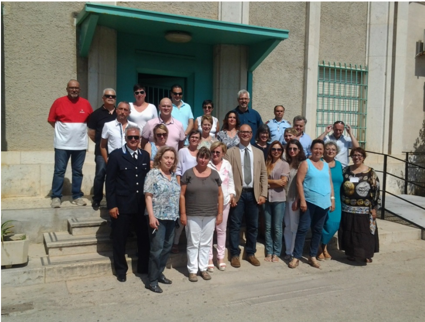
“Delegazione di funzionari penitenziari in visita alla Casa circondariale”

Mielenkiintoisten raporttien jälkeen pääsimme seminaaripäivien kiehtovimmalle osuudelle, vankilavierailulle. FEFI-työseminaarit järjestetään aina sellaisessa kohdemaassa, jossa partnerina on myös paikallinen vankila. Tämä takaa sen, että papereiden pyörittelyn lomassa pääsemme tutustumaan itse asiaan, eli vankeihin ja vankilaan.