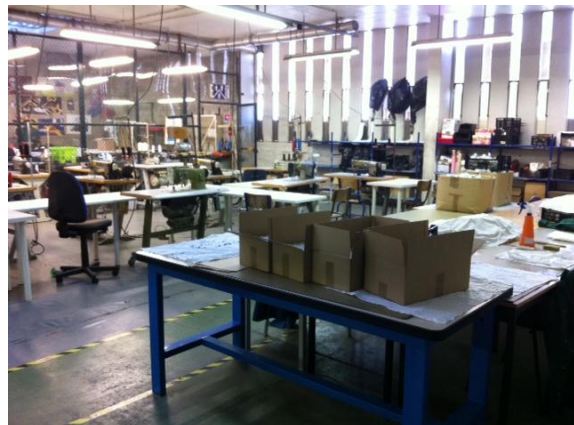
(Photographies : table de travail des femmes)