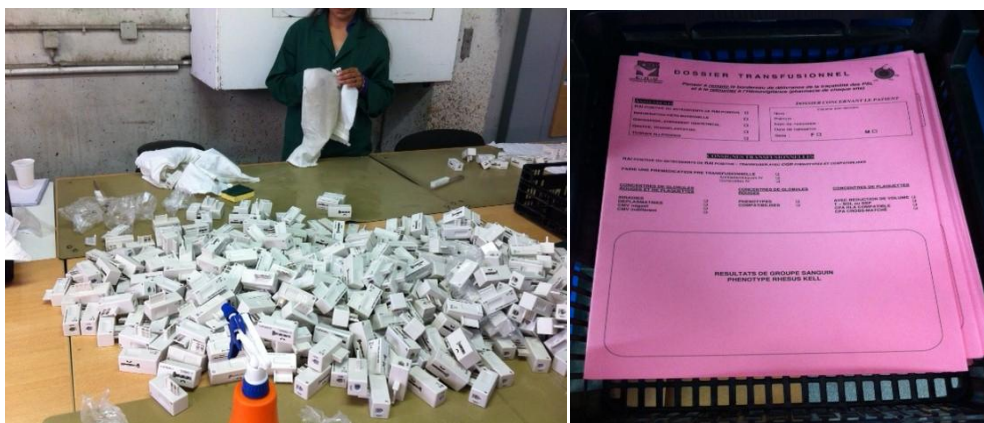
(Photographies : activités proposées aux femmes détenues au sein de l'atelier)

Les postes proposés à l'atelier unique hommes-femmes concernent des activités d'opérateurs : assemblage, conditionnement et façonnage. Les contrôleurs ont pu constater que les femmes s'occupaient de l'activité imprimerie façonnage (pliage et collage de dossiers médicaux du centre hospitalier de Bordeaux) ainsi que du tri et du nettoyage de filtres téléphoniques (dépeussierage, astiquage des pièces et rangement dans un bac).