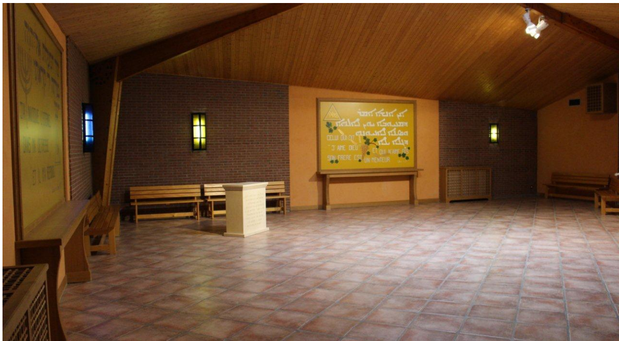
Salle poly-culturelles de la maison d'arrêt d'Osny.

L'expérience d'Osny montre que cette salle poly-culturelles est très valorisée au sein de l'établissement et partagée sans conflit entre les différents cultes.